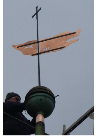
Turmknopf und Wetterfahne sitzen!

Wegen ihrer relativen Unzugänglichkeit galten Turmknäufe oft als sichere Aufbewahrungsorte für historische Zeugnisse aus der Zeit des Baus,