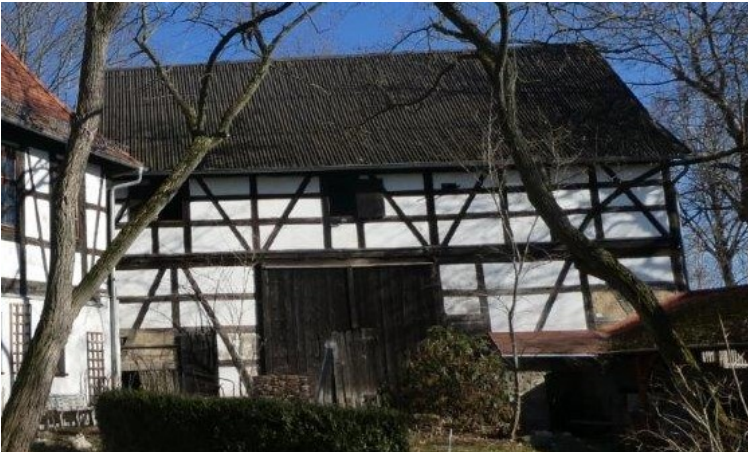
Die Scheune im Pfarrhof

Ziel des Vorhabens ist es, in den Dörfern der Kirchengemeinden Tschirma, Nitschareuth, Kühdorf und Wittchendorf ein niedrighschwelliges Kulturangebot zu schaffen, das über die Grenzen der Generationen und