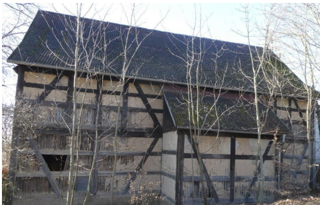
Die Scheune von „hinten“

Dafür wird 2019/2020 zunächst die alte Pfarrscheune in Tschirma nutzbar gemacht. Dazu müssen vor allem die maroden Fundamente erneuert werden und ein vorsichtiger Innenausbau erfolgen. Das Gebäude bleibt aber eine Scheune mit ihrer rustikalen Art.