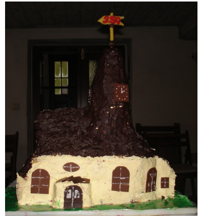
Die Nitschareuther Kirche als Backwerk, entstanden zur 350-Jahr-Feier.

Wir werden auf Spenden angewiesen sein und freuen uns, wenn Sie auch dieses Projekt finanziell mit uns tragen.