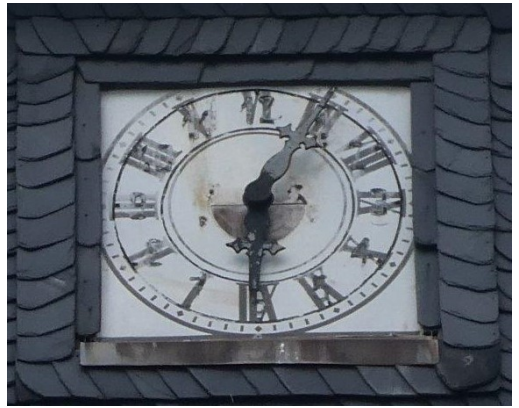
Die Kirchturmuhre Tschirma, so wie das Zifferblatt bisher angebracht war.

Die neuen Zifferblätter werden demnächst trotzdem richtig herum angebracht.