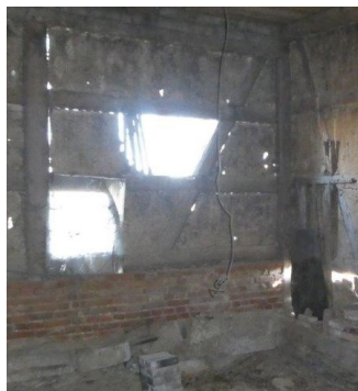
Detail: Zustand der Scheune