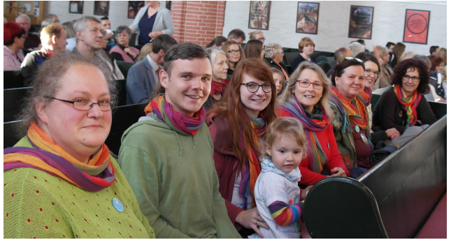
Die Arbeitsgruppe in der Elbingeröder Kirche

„Familien brauchen Gemeinschaft und Unterstützung, aktive Gemeindearbeit hilft und unterstützt Familien und schafft Möglichkeiten, Gemeinschaft zu erleben und zu gestalten.“ Unter dieser Überschrift fand in unserer Landeskirche ein Wettbewerb statt, bei dem wir uns beteiligt haben. Dazu hatten wir im Antrag dargestellt, was in unseren dörflichen Gemeinden alles für